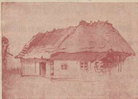
Хата, де народився Т. Шевченко.